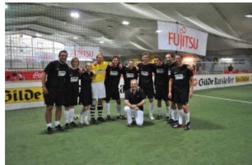
(White IT - Mannschaft 2011)

Wer bei den Spielen zusehen und natürlich unsere Mannschaft tatkräftig unterstützen möchte, hier der genaue Ort: